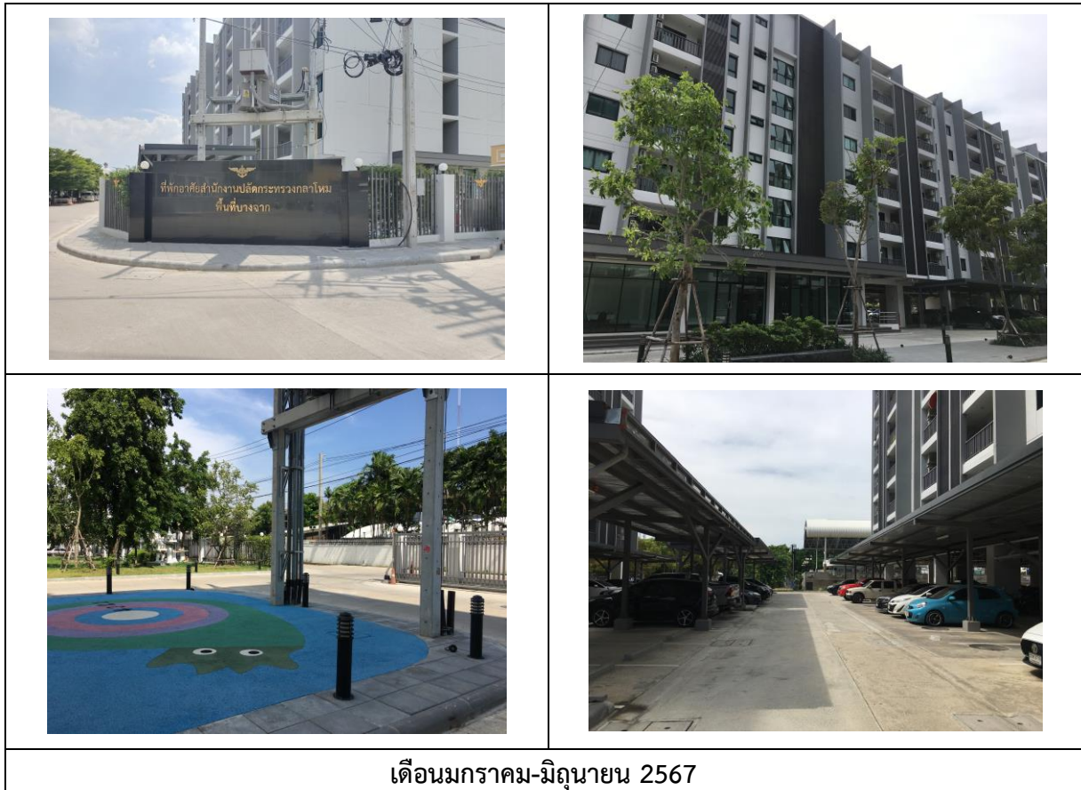
เดือนมกราคม-มิถุนายน 2567

การดำเนินงานปัจจุบัน (เดือนเดือนมกราคม-มิถุนายน พ.ศ. 2567) โครงการก่อสร้างอาคารพักอาศัย พร้อมสิ่งอำนวยความสะดวกของ สำนักงานปลัดกระทรวงกลาโหม (พื้นที่บางจาก (พื้นที่ 1)) เป็นการดำเนินงานในระยะดำเนินการ แสดงดังรูปที่ 1.3-1